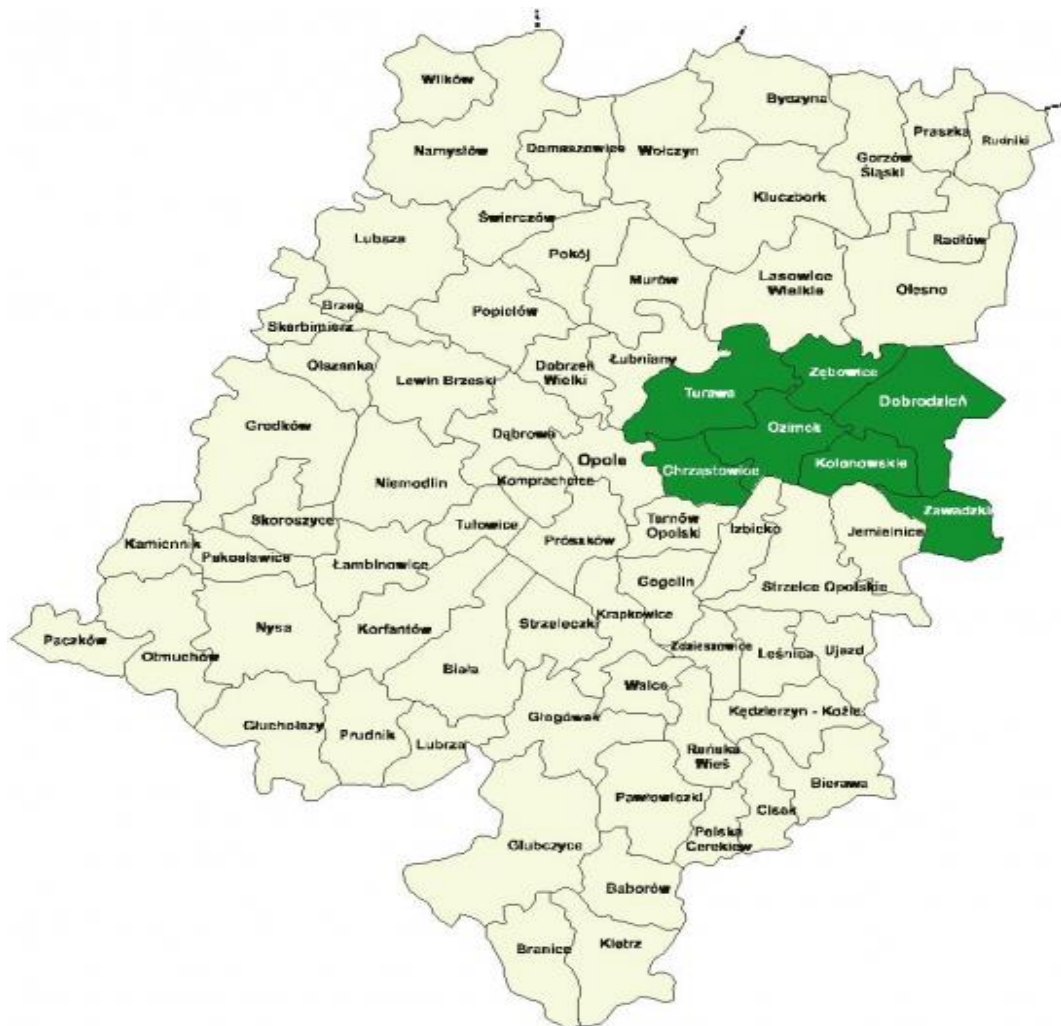
Rysunek 1. Obszar LGD „Kraina Dinozaurów”.

Obszar LGD „Kraina Dinozaurów” obejmuje siedem sąsiadujących ze sobą gmin wiejskich i miejsko-wiejskich województwa opolskiego, z trzech powiatów: opolskiego – gminy Chrzastowice, Ozimek i Turawa, oleskiego – gminy Dobrodzień i Zębowice oraz strzeleckiego – gminy Kolonowskie i Zawadzkie. Teren Krainy Dinozaurów zlokalizowany jest na Równinie Opolskiej wchodzącej w skład Niziny Śląskiej i w całości położony jest w zlewni rzeki Mała Panew i jej dopływów. Pod względem powierzchni największa jest gmina Turawa, a najmniejsze gminy to Chrzastowice i Zawadzkie. Obszar LGD zajmuje 804,77 km 2 co stanowi 8,5 % powierzchni województwa opolskiego. Gminy obszaru LGD leżą w bezpośredniej bliskości, tworząc zwarty obszar zarówno pod względem osadniczym, jak i infrastrukturalnym.